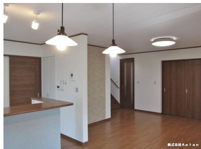
施工例 千葉県松戸市S様邸