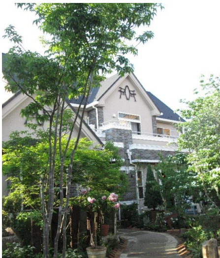
施工例 国分寺市caféKO・KU・BU