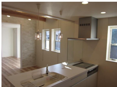
施工例 千葉県松戸市N様邸